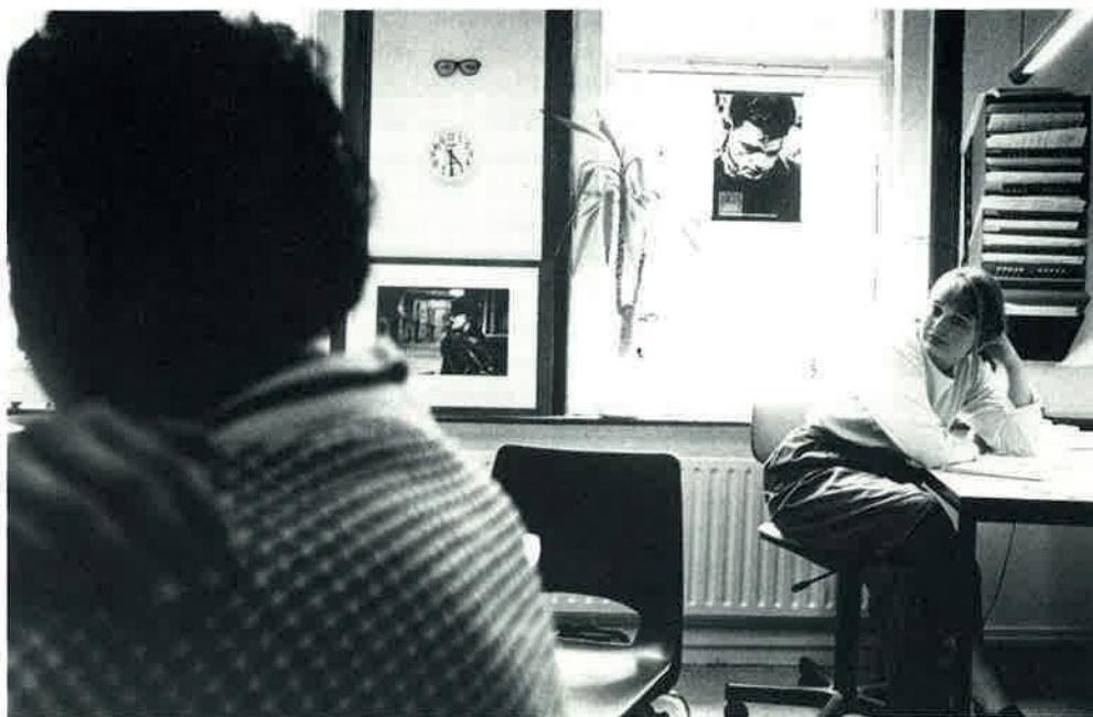
Stichting Argus te Utrecht

Volgens Fijn wordt in een voorlopig standpunt gedacht aan een nieuwe unit jeugdreclassering binnen de nieuwe structuur die men voor ogen heeft. Vroeghulp moet wel bij justitiële organisaties blijven; uitbesteding aan niet-justitiële organisaties is niet acceptabel. In een nieuwe organisatie wordt het probleem